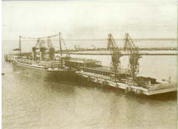
Le mole d'escale du Verdon-sur-Mer

Le 28 juin 1940, 27 parlementaires embarquaient au Verdon sur le paquebot le « Massilia ». parmi eux, se trouvaient Georges Mandel député Maire de Soulac – sur-mer, mais aussi Pierre Mandes France. Conformément à la décision prise en Conseil des Ministres, ils veulent continuer depuis l’Afrique du Nord le combat contre l’Allemagne nazie