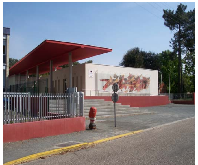
Collège Georges MANDEL (Soulac-sur-Mer)